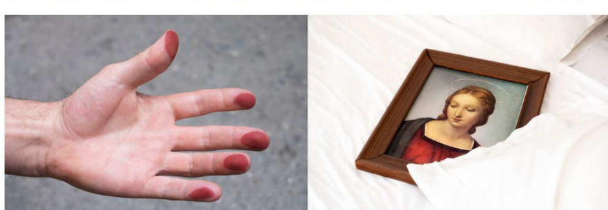
Histoires courtes

Publié par FABIENRIBERY le 14 DÉCEMBRE 2018